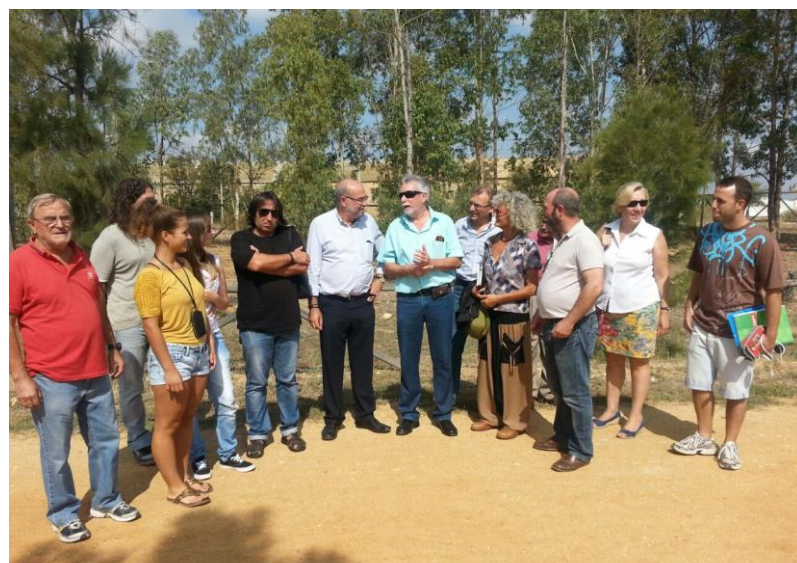
Miembros de la Asamblea Local de IU de San Juan del Puerto, junto a miembros de la Dirección Provincial de Izquierda Unida y el Viceconsejero de Turismo

conseguidas todas estas cuestiones solicitaremos un anexo para la temporada de verano en el Muelle del Vigía en Mazagón, con la petición de unas láminas de agua para las embarcaciones de nuestro Club.